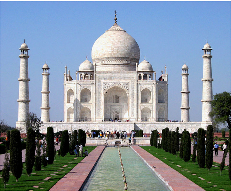
El Taj Mahal es un ejemplo de la simetría en la arquitectura.

B elleza es una noción abstracta ligada a numerosos aspectos de la existencia humana. Este concepto es estudiado principalmente por la disciplina filosófica de la estética, pero también es abordado por otras disciplinas como la historia, la sociología y la psicología social.