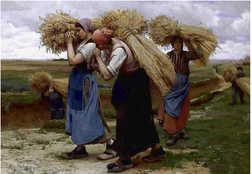
Julien Dupré 1859-1910

La percepción de la «belleza» a menudo implica la interpretación de alguna entidad que está en equilibrio y armonía con la naturaleza, y puede conducir a sentimientos de atracción y bienestar emocional. Debido a que constituye una experiencia subjetiva, a menudo se dice que «la belleza está en el ojo del observador». En su sentido más profundo, la belleza puede engendrarse a partir de una experiencia de reflexión positiva sobre el significado de la propia existencia.